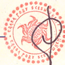
Арсений Станиславович Черноморов Комиссар ГКЧП СССР Генерал-лейтенант